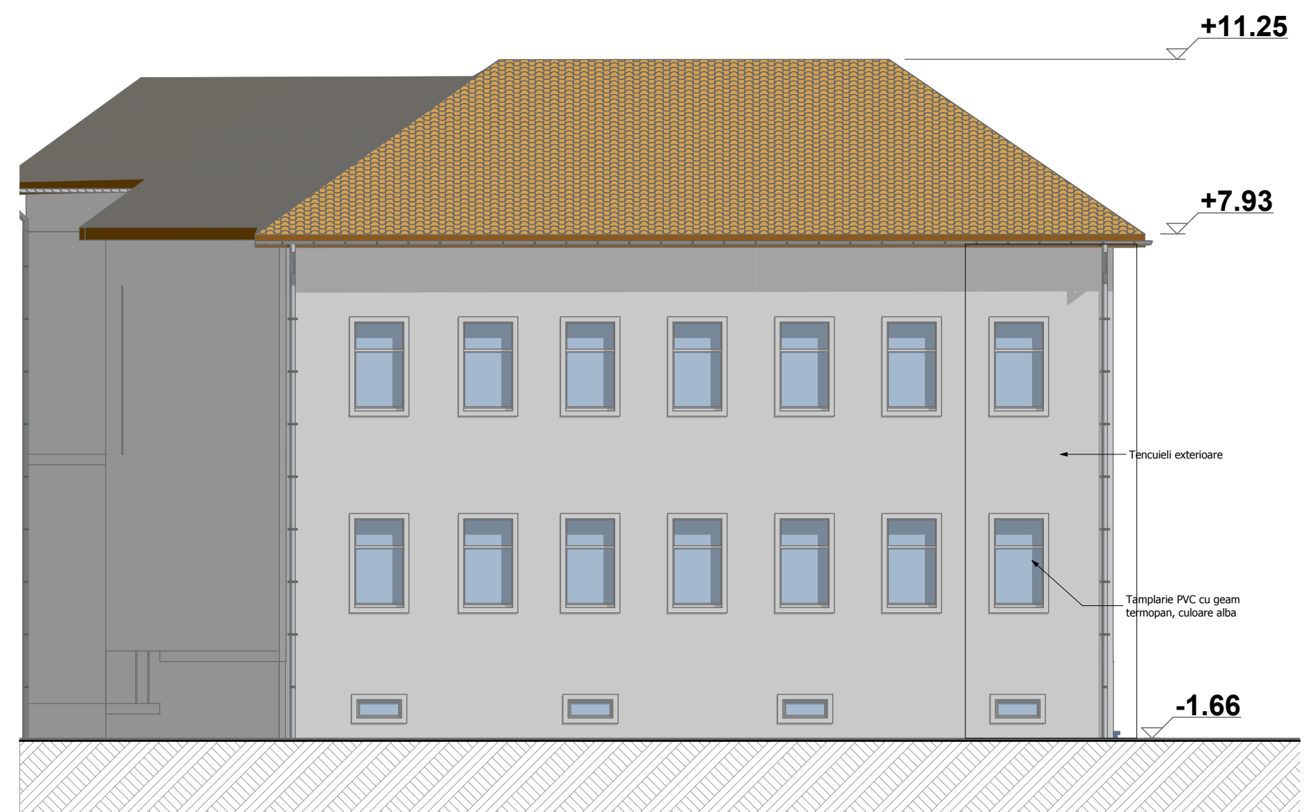
FATADA SUD SCARA 1:100